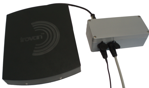
LID 650 im Gehäuse mit Antenne